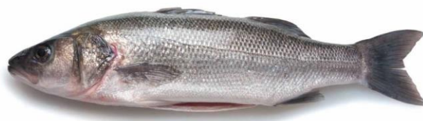
Slika 1. Lubin ( Dicentrarchus labrax )

http://www.hlede.net/studentski_radovi/ribe/RibeSveZajedno.pdf (20.02.2020.)