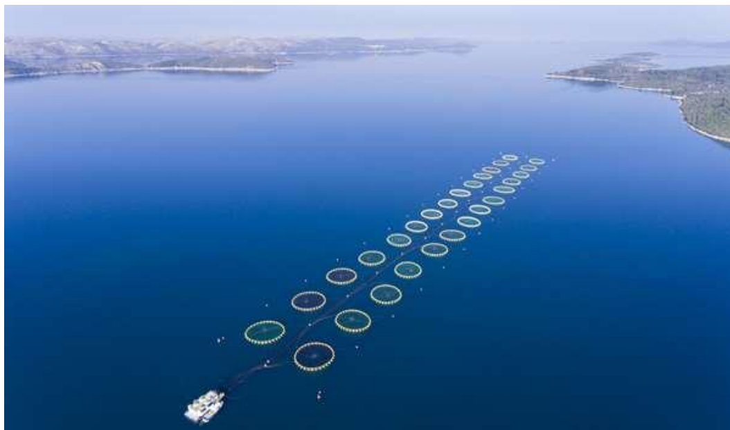
Slika 3. Kavezi za uzgoj ribe. Cromaris, Zadar

Važan dio ribarstva čini akvakultura, koja se bavi uzgojem vodenih organizama, prvenstveno riba (ANONYMOUS, 2015). Uzgojena riba važan je dio prehrane ljudi, tim više što je izlov ribe posljednjih desetljeća u stagnaciji gotovo u cijelom svijetu. Najznačajnije uzgojne vrste slatkovodnih riba u Hrvatskoj su šaran i kalifornijska pastrva. Dominantne uzgojne vrste u hrvatskoj marikulturi su: lubin, komarča i tuna. Posljednjih godina u uzgoj se uvode i nove vrste kao što je npr. hama ( Argyrosomus regius ) (ANONYMOUS, 2019a). Morsku ribu se uzgaja gotovo u svim obalnim županijama, najviše u Zadarskoj (BUHA, 2015) i to uz primjenu najmodernijih tehnologija (Slika 3.). Tuna iz uzgoja plasira se uglavnom na japansko tržište, dok se „bijela riba“ plasira na domaće, ali i na tržište Europske unije (ANONYMOUS, 2019a).