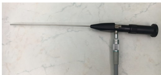
Slika 2.: Rigidni endoskop