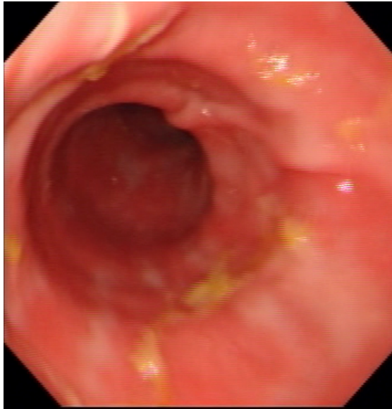
Slika 4. Fiziološki izgled kolona psa

Još je važno napomenuti da endoskopsku pretragu pacijenti vrlo dobro toleriraju, nije invazivna te su komplikacije iznimno rijetke (CHAMNESS, 2013.).