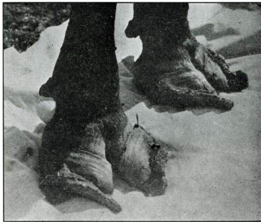
Slika 5. Deformacije papaka u goveda uzrokovana otrovanjem selenom