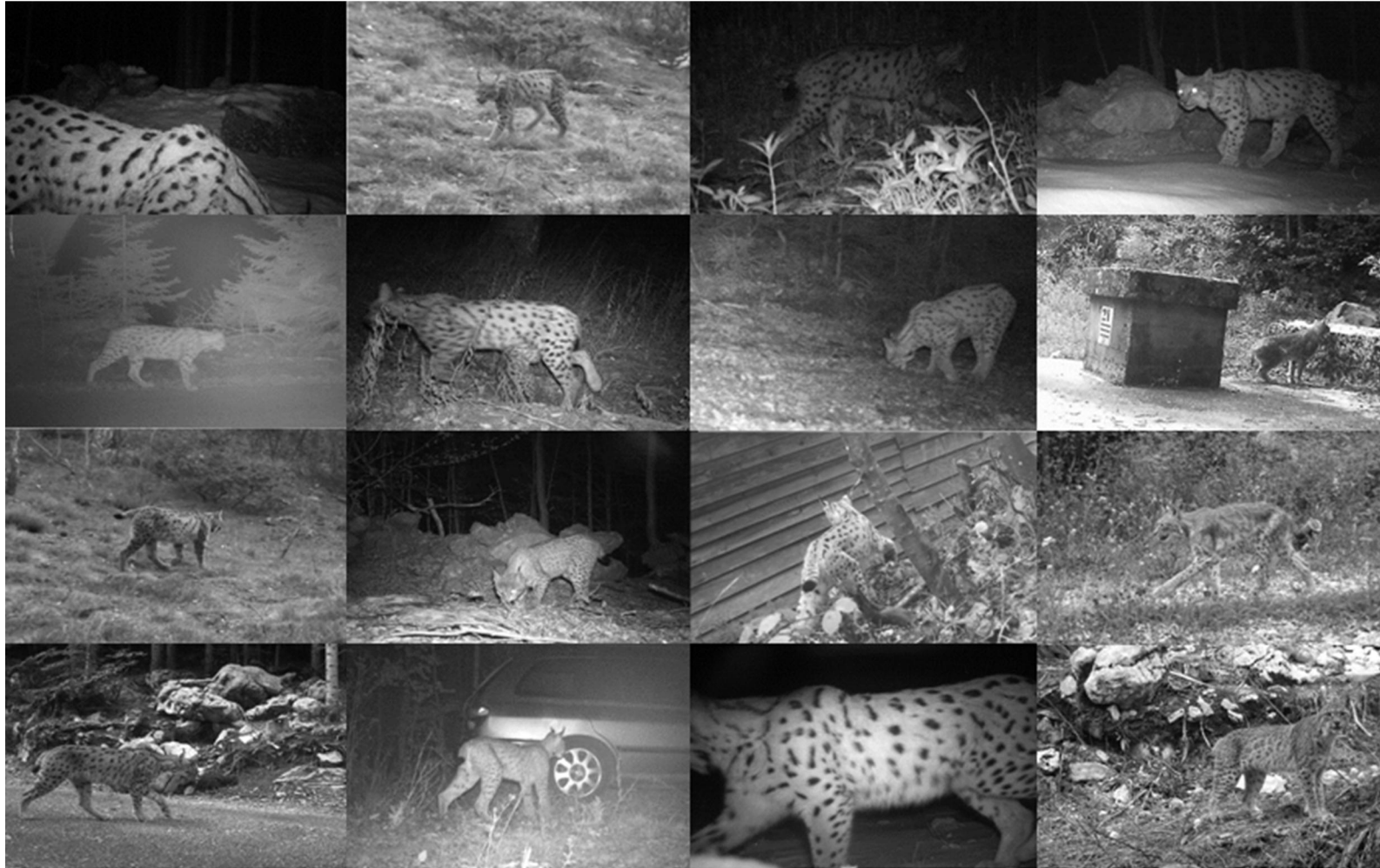
Slika 5. Risovi fotoidentificirani na području Velebita, s lijeve na desnu stranu - L10, CRO583, L4, L2, L3, L1, L7, R5, CRO584, R1, L8, R3, L5, R4, L9 i L6