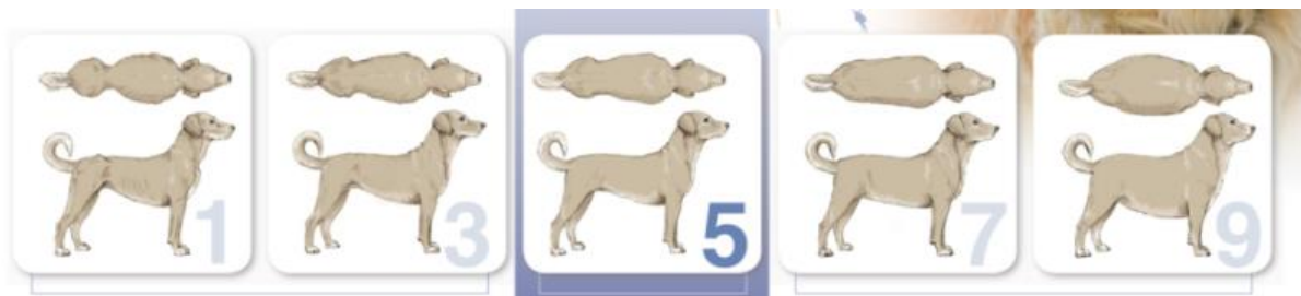
Slika 3. BCS; Prikaz ocjene tjelesne kondicije pasa primjenjujući bodovnu skalu od 1 do 9 (WSAVA, 2013).

Kondiciju je potrebno procjenjivati svaka dva tjedna. Važno je napomenuti da ju je potrebno pratiti, ali s oprezom, jer je skala za procjenu kondicije validirana za životinje u odrasloj dobi, a ne za štenad. Navedeno je od izuzetne važnosti poglavito u eksponencijalnoj (brzoj) fazi rasta kada je vrlo lako podcijeniti ocjenu kondicije, poglavito kod gigantskih pasmina pasa kod kojih je ta faza izraženija. Cilj je postići umjereni intenzitet rasta, a ne maksimalni kako bi se izbjegle nepoželjne posljedice poput patologija koštanog sustava i prekomjerne tjelesne težine. Ciljna masa u odrasloj dobi neće ovisiti o intenzitetu rasta.