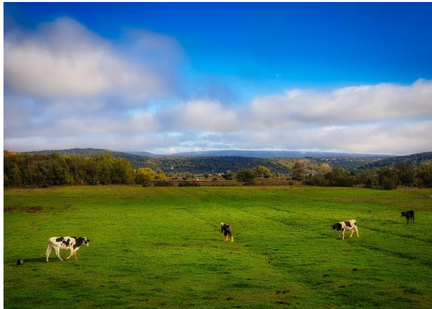
Slika 3. Goveda na pašnjaku ljeti.

Ponašanje goveda pri hranjenju ovisi o tome hrane li se životinje na paši ili u staji. Vrijeme hranjenja u staji iznosi 4 – 6 sati, a kod životinja koje slobodno pasu na pašnjaku 6 – 10 sati dnevno. Osim toga, ispaša ovisi i o pasmini goveda, klimi te kvaliteti vegetacije. Mliječne pasmine u prosjeku pasu kraće od mesnih. Goveda na pašnjaku u ljetnim danima (slika 3) mogu provesti i do 17 sati dnevno, dok se zimi to vrijeme smanjuje na oko 5 sati. Trajanje hranjenja ovisi i o dostupnosti hrane. Na pašnjacima je hrana dostupna cijelom stadu istodobno, dok je kod hranjenja u staji dostupnost hrane ograničena prostorom i hijerarhijskim poretkom (VUČEMILO i sur., 2019.).