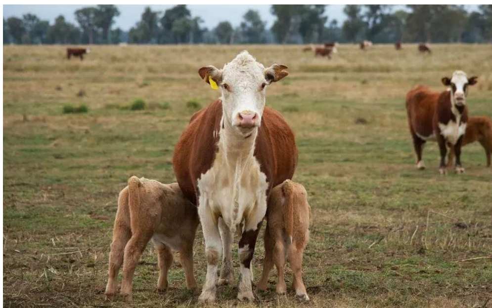
Slika 10. Krava s blizancima.

Najčvršća veza između majke i teleta ostvaruje se 5 minuta nakon porođaja. Majke se izrazito zaštitnički ponašaju prema svojim mladuncima, osobito Angus pasmine. Iz tog razloga posebna se pažnja mora pridati kada se prilazi majci s mladunčetom. Nije strano da krava pojede dio ili cijelu placentu. Placentofagija je utvrđena u otprilike 82 % slučajeva promatranih porođaja. Na taj način krava skriva dolazak teleta na svijet, štiteći ga od grabežljivaca (HOUPT, 2011.). Kad odlaze na pašu, krave ostavljaju telad samu, na skrovitom i od vjetra zaštićenom mjestu (VUČINIĆ, 2006.). Istraživanja su pokazala da ukoliko se o kravama skrbi tijekom porođaja, to rezultira lakšim rukovanjem tijekom mužnje. U nekim slučajevima junice nakon porođaja krenule su napadati svoje tele glavom ili rogovima, ali do danas razlozi takvim napadima nisu objašnjeni (HOUPT, 2011.; TUCKER, 2014.; EKESBO i GUNNARSSON, 2018.).