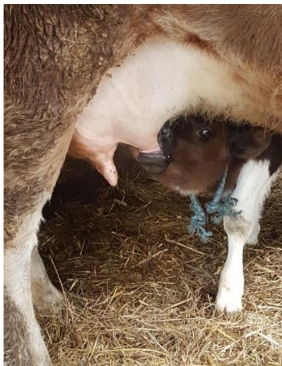
Slika 13. Tele na sisi.

Krava ne prekida vezu s jednogodišnjim teletom ni kada se ponovno oteli; čak mu može dopustiti da siše, iako postaje agresivnija prema njemu nakon rođenja novog teleta (HOUP, 2011.). Kod mesnih pasmina goveda tele uobičajeno ostaje s majkom do odbića, otprilike šest mjeseci, a kod mliječnih unutar nekoliko sati do dan nakon porođaja. Nije rijedak slučaj da se tele odvaja odmah nakon porođaja. Uz što veću proizvodnju mlijeka, smatra se da se time sprječava prijenos bolesti i olakšava mužnja. Mliječna telad odbija se od sisanja s 5 – 12 mjeseci starosti (TUCKER, 2014.). Rano odbiće teladi jedan je od glavnih problema dobrobiti životinja u mljekarskoj proizvodnji (MIKUŠ i sur., 2018.) te predstavlja izrazit stres kako za tele tako i za kravu, bez obzira na postupke uzgajivača (VUČEMILO i sur., 2019.).