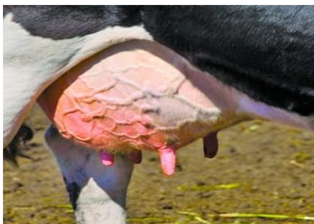
Slika 12. Mastitis.