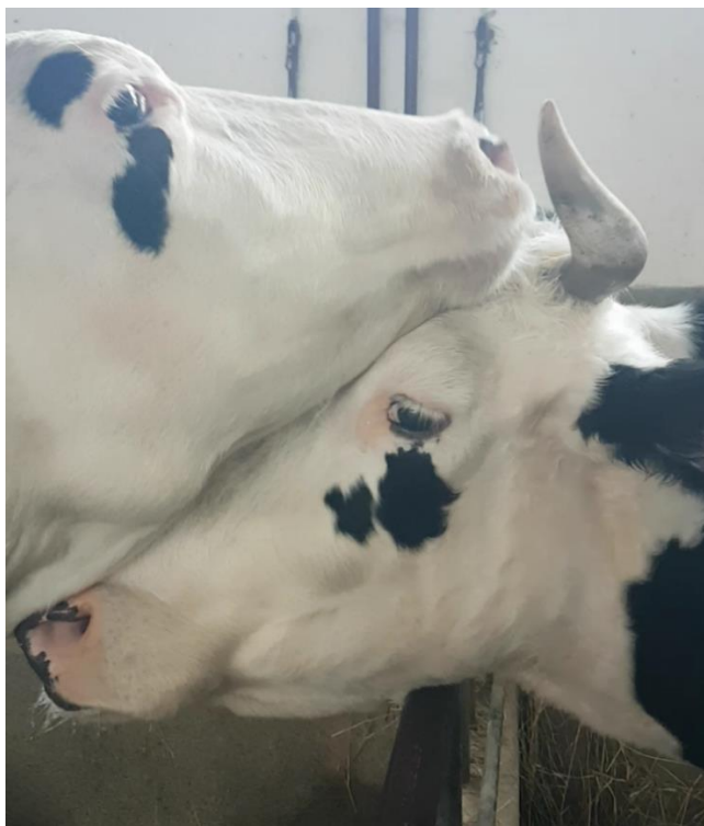
Slika 2. Prijateljsko ponašanje krava.

VUČEMILO i sur., 2019.). Goveda lakih pasmina dominantnija su nad onima težih pasmina (VUČINIĆ, 2006.).