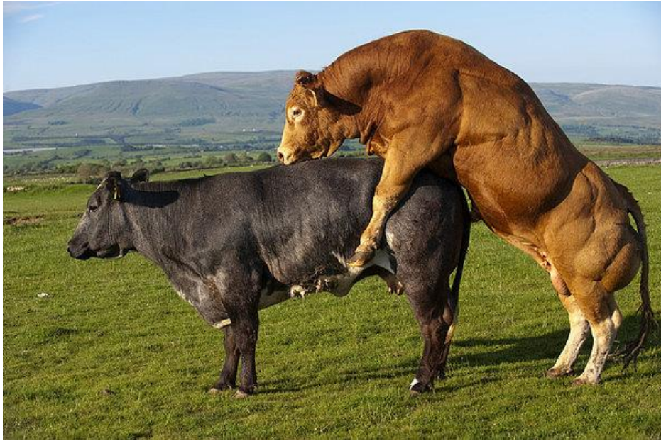
Slika 6. Parenje goveda.