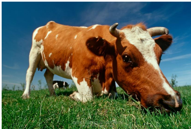
Slika 8. Oslanjanje goveda na koljena pri ustajanju.

Tijekom ustajanja iz ležećeg bočnog položaja krava zabaci glavu u stranu i tim pokretom se postavi u ležeći položaj na prsnoj kosti i prednjim koljenima (slika 8). Nakon toga podiže stražnji dio tijela i staje na stražnje noge. Ustajanje završava dizanjem na prednje noge (EKESBO i GUNNARSSON, 2018.). Držatelji stada i kliničari trebaju voditi brigu o životinjama koje su pod stresom uzrokovanom deprivacijom sna (HOUP, 2011.).