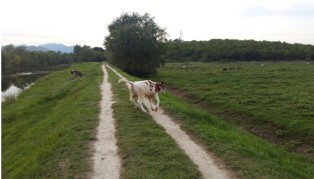
Slika 14. Igra teleta.

Telad je osobito motivirana za sisanje. U sustavima proizvodnje u kojima se telad hrani ograničenim količinama mlijeka potreba za sisanjem može ostati nezadovoljena. Tako se pojavljuje nenormalno ponašanje u obliku međusobnog sisanja kada telad siše uške, plahticu, prepucij i druge dijelove tijela druge teladi. Telad se često hrani mlijekom u količini od 10 % tjelesne mase, no jasni su dokazi da ta količina nije dovoljna. Takvo se ponašanje može smanjiti hranjenjem na dudu (TUCKER, 2014.).