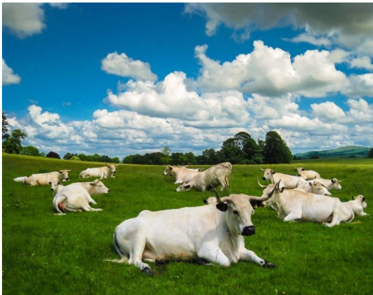
Slika 7. Odmaranje goveda s ispruženom prednjom nogom.

Krava započinje lijeganje spuštanjem glave i smještanjem jedne stražnje noge ispred druge i oslanjanjem na nju. Životinja se prvo spušta na prednja koljena te na prsnu kost i laktove. Nakon toga spušta stražnji dio tijela i prenosi težinu tijela na stražnju nogu, trup i bedro. Stabilnost joj pružaju u ovom položaju prednje noge koje su savijene (EKESBO i GUNNARSSON, 2018.; VUČEMILO i sur., 2019.).