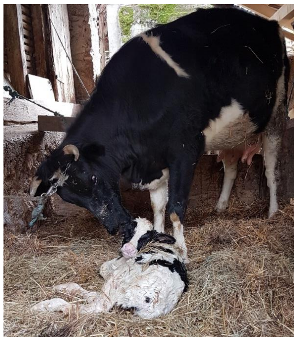
Slika 11. Krava liže novorođeno tele.