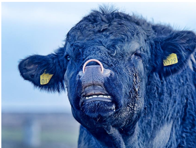
Slika 5. Flehmenska reakcija.

Istraživanja su pokazala da se reproduksijska učinkovitost bikova ne poboljšava ako sazrijevaju zajedno sa ženkama, za razliku od, primjerice, ovnova. Pojedinačno držanje mužjaka smanjuje njihovu spolnu aktivnost. Kod bikova koji su u blizini ženki koje se tjeraju nisu rijetki djelomična erekcija i izbacivanje penisa. Bikovi mesnih pasmina manje su spolno aktivni od mliječnih bikova. Hijerarhijski poredak među bikovima utječe na učestalost skokova i parenja sa ženkama. Bikovi njuše i ližu okolinu stidnice krava koje su u estrusu. Flehmenska reakcija (slika 5), koja se očituje ispužanjem vrata i podizanjem gornje usne, pomaže feromonima da dopiju do vomeronazalnog organa na gornjem nepcu. Ta reakcija kod goveda traje 10 – 30 minuta. Udaranjem rogovima o tlo, kopanjem prednjim nogama, bacanjem zemlje, spuštanjem glave, širenjem nozdrva i stenjanjem bikovi pokazuju svoju muškost. Parenju prethodi udvaranje između mužjaka i ženke. Bik se približava kravi, pase travu pored nje i štiti je od drugih jedinki. Događalo se i da bik pokuša odvojiti kravu od stada. U prvoj fazi parenja mužjak naskače na ženku prednjim nogama koje mu služe kao uporište i osiguravaju stabilnost. Nakon opasivanja, mišići zdjelice se zgrče i dolazi do intromisije penisa (slika 6). Ejakulacija nastupa nakon nekoliko jakih pokreta zdjelice. Dominantan bik u stadu obavi najviše skokova i parenja (VUČINIĆ, 2006.; HOUP, 2011.).