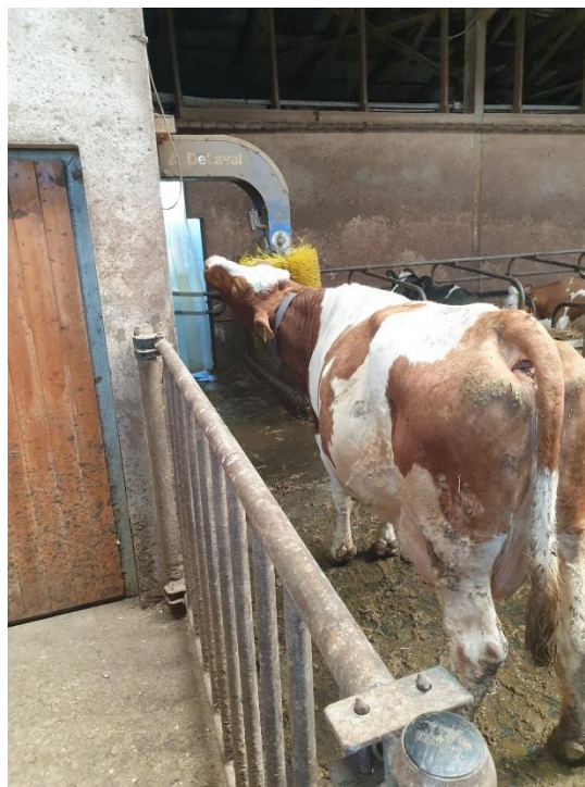
Slika 9. Četka za njegu.

trebao biti argument protiv obogaćenja okoliša ako se vodi računa o gustoći naseljenosti životinja i dovoljnom broju raspoloživih predmeta (ŠIMIĆ i sur., 2018.).