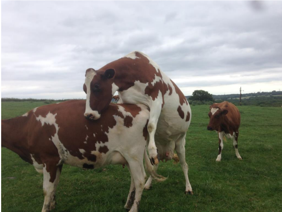
Slika 4. Naskakivanje krava u estrusu.