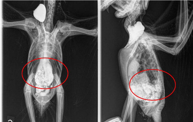
Slika 3. RTG snimka afričke sive papige sa vidljivim proširenjem proventrikula (crveni krug).

Za života se također može uzeti obrisak kloake ili skupni uzorak izmeta za dokaz virusa PCR metodom, no rezultati mogu biti lažno negativni zbog toga što neke ptice ne izlučuju virus prilikom svakog defeciranja (PAYNE i sur., 2012.; JOAO BRANDAO i BEAFRERE, 2013.). Zato se preporučuje da se izmet skupi tri puta u tjednim intervalima (DOVČ i sur., 2016.).