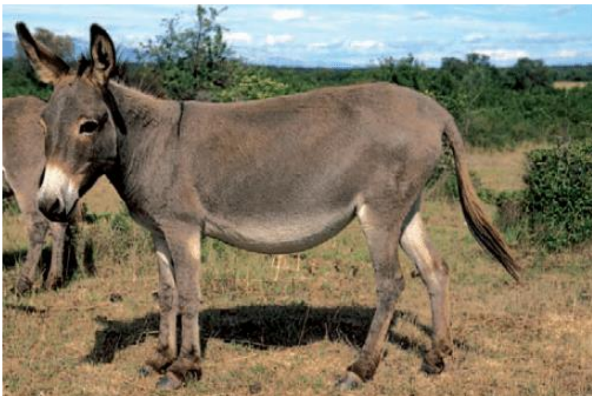
Slika 3. Primorsko-dinarski magarac

Prema banci gena Ministarstva poljoprivrede RH, populacija sjeverno-jadranskog magarca u 2020. godini brojala je devet muških jedinki te 71 žensku jedinku, zbog čega ta pasmina pripada kritično ugroženoj populaciji (Anon., 2021.b).