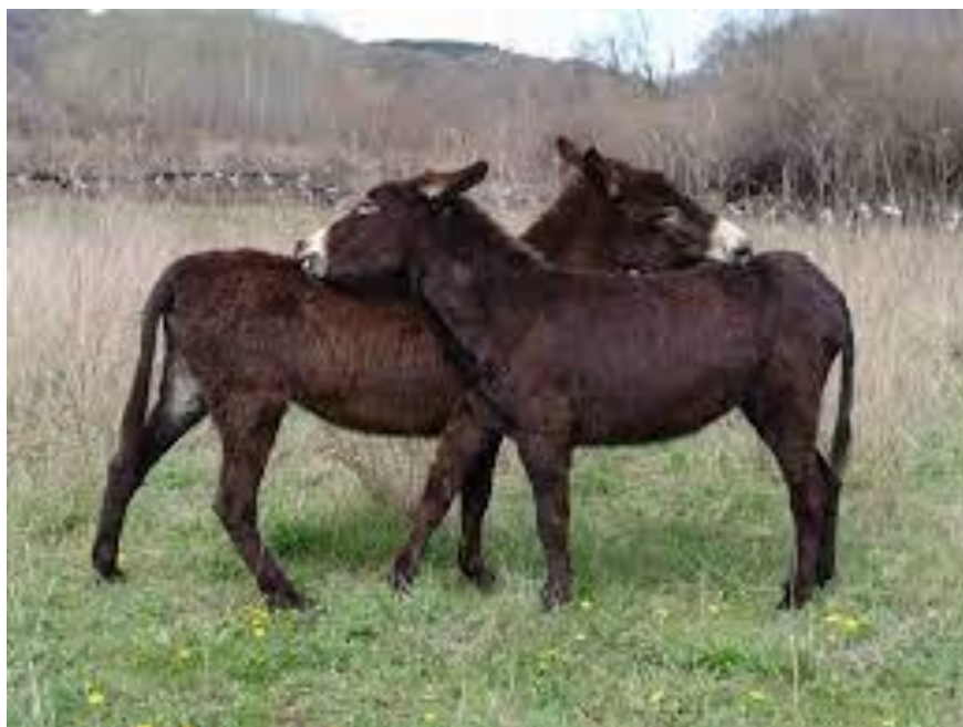
Slika 2. Sjeverno-jadranski magarac