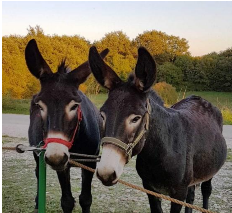
Slika 1. Istarski magarac

Razvrstavanje magaraca prema pasminama i upis u matične knjige započeli su 2014. godine, a do tada se vodila jedinstvena evidencija za sve populacije magaraca. Izvorne pasmine magaraca štite se kroz in situ programe, a s obzirom na veličinu populacije primorsko-dinarski magarac je najbrojniji, dok su sjeverno-jadranski i istarski magarac u skupini kritično ugroženih (Anon., 2012.d). In situ očuvanje označava uzgoj populacija domaćih životinja namijenjenih održivoj poljoprivrednoj proizvodnji u izvornom okolišu. In situ očuvanje uključuje identifikaciju, označavanje i registraciju domaćih životinja u matičnim knjigama, provedbu procjene odlika i progenog testiranja, genetskog vrednovanja na temelju uzgojnih programa uz poseban naglasak na očuvanju genetske raznolikosti unutar pasmine, te provedbu specifičnih mjera u očuvanju i zaštiti zdravlja. Ove mjere podliježu odredbama Zakona o uzgoju domaćih životinja ("Narodne novine", broj 115/18.) i Zakona o veterinarstvu ("Narodne novine", br. 82/13., 148/13. i 115/18.).