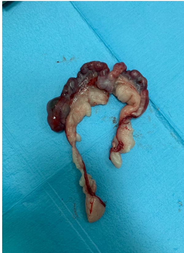
Slika 2. Tumorozno promijenjena maternica u ženke kunića.

tumor. Benigni tumori dijagnosticirani kod ženki kunića kućnih ljubimaca su leomiom, adenom i hemangiom (QUESENBERRY i sur., 2021.c). Polipi maternice također se smatraju tumorima maternice, a mogu biti benigni i maligni (BERTRAM i sur., 2018.).