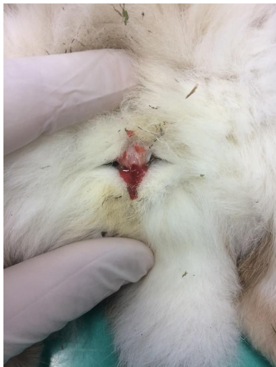
Slika 3. Serosangvinozni vaginalni iscjedak u ženke kunića (autor: izv. prof. dr. sc. Ivan Folnožić).

(HARCOURT-BROWN, 2017.; QUESENBERRY i sur., 2021.b). Neoplastične su promjene u većini slučajeva prisutne u oba roga maternice, u obliku polipa ili nodularnih tvorbi koje prominiraju u lumen maternice (HARCOURT-BROWN, 2017.). Adenokarcinom maternice je sporo progresivna bolest te zbog svog kroniciteta dugo može ostati nezamijećena (QUESENBERRY i sur., 2021.b). Prvi nespecifični simptomi usmjereni su prema problemima u reprodukciji. S rastom tumora klinički znakovi postaju sve izraženiji. Gubitak tjelesne mase, distenzija abdomena, smanjen apetit, hematurija, serosangvinozni do gust, tamnocrven vaginalni iscjedak (Slika 3.) (BISHOP, 2002.; QUESENBERRY i sur., 2021.b).