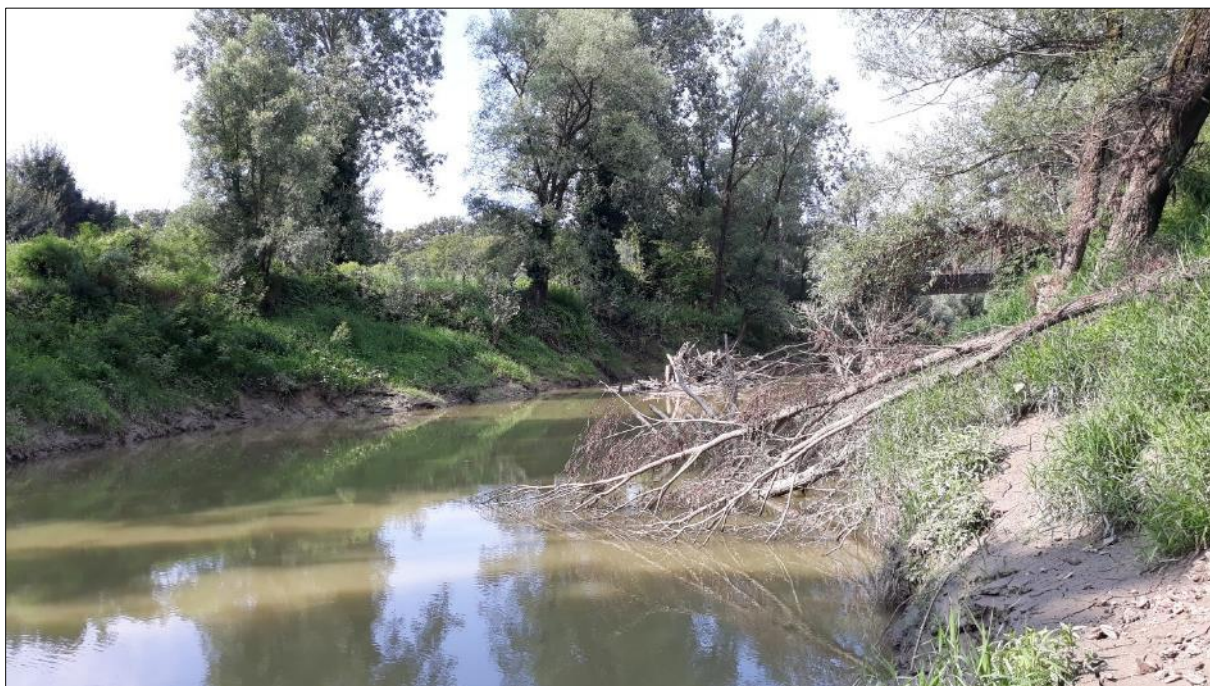
Slika 2. Rijeka Ilova; (K. Matanović).

U srebrnih karasa podrijetlom s ribolovnog područja Sava i ribolovnog područja Drava-Dunav, ulovljenih u sklopu ribolova provedenog radi znanstvenog ili stručnog istraživanja, izrade planova upravljanja, provođenja programa praćenja stanja ribljeg fonda te provođenja nastavnih programa, utvrđena je invazija nametnikom roda Myxobolus . Od ukupno 99 srebrnih karasa prikupljenih u istraživanim ribolovnim vodama na oba ribolovna područja, spore nametnika Myxobolus sp. izdvojene su samo iz tri primjerka, jednog podrijetlom iz ribolovne vode rijeka Ilova (ribolovno područje Sava) (slika 2.) i dva podrijetlom iz ribolovne vode rijeka Vučica (ribolovno područje Drava-Dunav) (slika 3.).