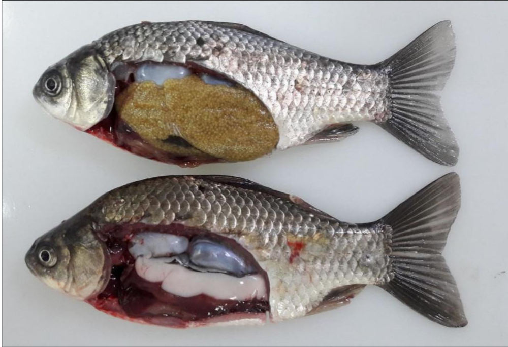
Slika 1. Srebrni karas ( Carassius gibelio ), ženka i mužjak.

mužjaka i ženki (slika 1.). Srebrni karas invazivna je vrsta koja prehranom konkuriira zavičajnim vrstama riba i jedan je od razloga smanjenja njihovih populacija (TOTH i sur., 2000.).