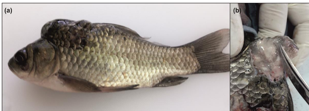
Slika 4. Srebrni karas ( Carassius gibelio ) invadiran nametnikom Myxobolus sp. a) Na slici je jasno uočljivo uzdignuće kože u području leđa, između glave i leđne peraje. b) Zahvaćeno područje kože i mišićja ispunjeno je bjelkastim sadržajem; (E. Gjurčević).

Kliničkim pregledom invadiranih primjeraka uočena su uzdignuća kože smještena obostrano u području leđa, između glave i leđne peraje. Kod jednog je primjerka na uzdignuću kože nastao čir iz kojeg izlazi bjelkasti sadržaj (slika 4.). Kod invadiranih primjeraka nisu uočene promjene u ponašanju.