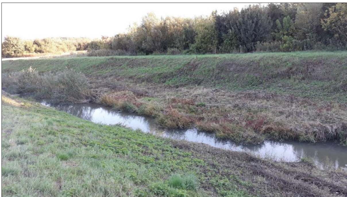
Slika 3. Rijeka Vučica; (K. Matanović).

Kliničkim pregledom invadiranih primjeraka uočena su uzdignuća kože smještena obostrano u području leđa, između glave i leđne peraje. Kod jednog je primjerka na uzdignuću kože nastao čir iz kojeg izlazi bjelkasti sadržaj (slika 4.). Kod invadiranih primjeraka nisu uočene promjene u ponašanju.