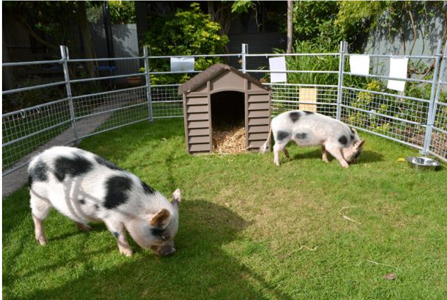
Slika 38: Vanjsko dvorište

Vrlo važno za ponašanje svinja je njihova znatiželja i istraživanje okoline. Znatiželja im je usmjerena na predmete na razini poda koje njuškaju i grickaju. U kući ovo ponašanje može dovesti do uništenja tepiha, odjeće, namještaja, čak i zida. Postoje primjeri gdje je svinja uspjela izvaditi knjige iz najniže police te kako može otvoriti vrata njuškom. Tim ponašanjem zadovoljava svoju znatiželjnu prirodu, stoga njenu okolinu treba obogatiti predmetima kojima može manipulirati. Također im se u dvorištu treba omogućiti područje gdje će moći rovati što je normalno svinjsko ponašanje.