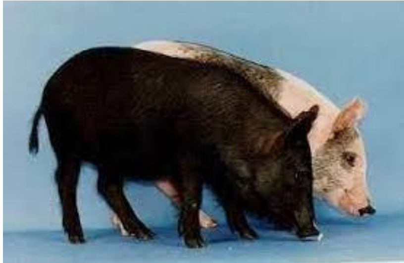
Slika 30: Sinclair (Minnesota ili Hormel) patuljaste svinje

istraživačkom centru (posjeduje jednu zatvorenu populaciju). Cilj njihovog selekcijskog rada je uzgojiti jedinke specifičnog fenotipa i dobrog zdravlja. Izvoze se u Kanadu, diljem SAD-a, Europu i Aziju uz uvjet da se ne koriste u drugim uzgojima.