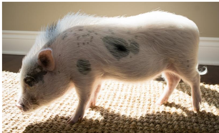
Slika 51: Piloerekcija duž kralježnice

One su životinje krda i najbolji suživot za svinju bi bio s još jednom svinjom. Vokalizacijom uspostavljaju komunikaciju. Kako bi se bolje fokusirale na zvukove, okreću glavu u smjeru njegova izvora. Uobičajeno roću dok hodaju te njuše i ruju dok se hrane. Pojačano se glasaju ako se izoliraju i ako nisu u skupini. Kod uzbuđenosti, duž kralježnice, nastaje vidljiva piloerekcija (slika 51). Čekinje su u tom dijelu dosta duže od ostalih čekinja na tijelu. Dugotrajni pokreti repa pokazatelj su pozitivnih emocija, dok su visokofrekventni pokreti uški znak smanjene dobrobiti ( https://awionline.org ).