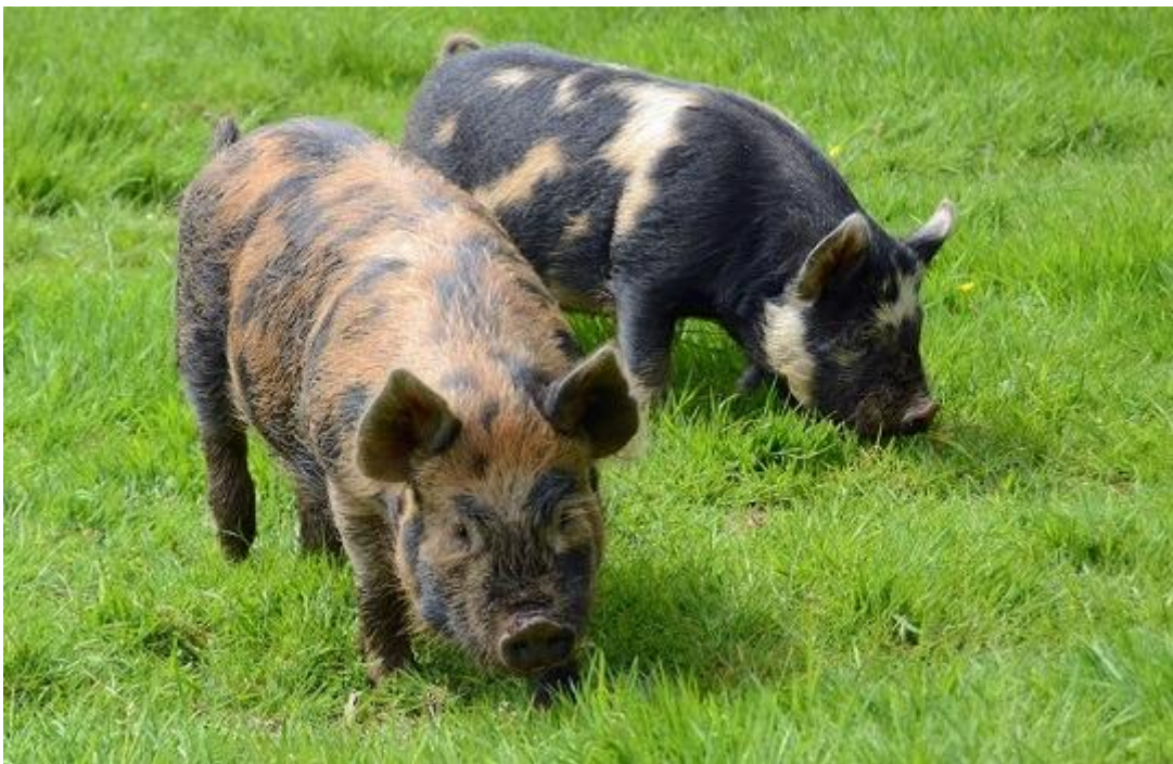
Slika 4: KuneKune patuljaste svinje

Tijelo je okruglo, ramena ravna i proporcionalna. Prsni koš se nalazi između malih, kratkih nogu. Leđa trebaju biti snažna, ravna ili zaobljena (slika 4) ( https://www.britishkunekunesociety.org.uk ).