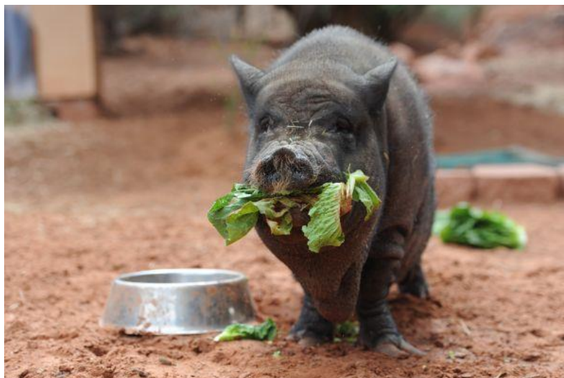
Slika 44: Patuljasta svinja jede zelje

mokraćnih kamenaca. Umjereno topla voda s dodatkom nekoliko žlica soka (brusnica, jabuka, naranča) potaknuti će svinju na napajanje.