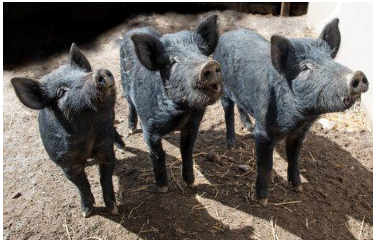
Slika 35: Mulefoot patuljaste svinje

posebno šunke. Bile su rasprostranjene po cijelom kukuruznom pojasu Sjeverne Amerike, ali su bile česte i duž doline rijeke Mississippi. Poljoprivrednici su osnovali dvije udruge uzgajivača ove pasmine, a koje su brojale preko 200 registriranih stada. Kompaktnog su izgleda i ponekad teže čak do 250 kilograma. Glava im je mala i proporcionalna veličini tijela. Uške su im srednje dužine, nešto nagnute prema naprijed i donekle zašiljenog, tankog vrha. Imaju veliku i široku čeljust koja je blizu točke širokih ramena. Prsa su im također široka, ujednačena s vratom i ostatkom tijela. Noge su im srednje veličine, lijepo sužene i postavljene ispod tijela. Rep im je srednje dužine te se sužava pri vrhu. Obično su crne boje, no iznimno mogu imati bijele „točke“ na pojedinim dijelovima tijela. Nježne su i tihe i lako ih se uzgaja.