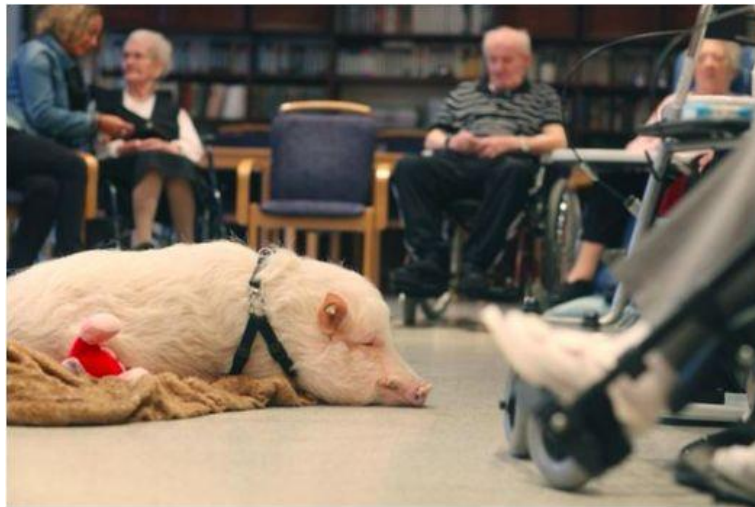
Slika 36: Terapijska patuljasta svinja u staračkom domu

Patuljaste svinje su iznimno inteligentne i empatične životinje što ih može učiniti izvrsnom terapijskom životinjom. Važno je znati razlike između terapijske životinje, životinje za emocionalnu potporu i uslužne životinje. Primjerice, u SAD-u, u slučaju da vlasnik želi svinju kategorizirati u tu svrhu, ona treba biti priznata kao ESA ( emotional animal ili terapijski kućni ljubimac). Tamo također vlasnici prakticiraju vođenje svog ljubimca u škole i staračke domove. Obitelji s djecom koja boluju od autizma prepoznale su pomoć svinja u smirivanju i vokalizaciji. Poznato je i da mogu otkriti niske razine šećera u krvi kod vlasnika s dijabetesom te upozoriti na nadolazeće napadaje. Mogu ublažiti anksioznost i napade panike te poboljšati simptome depresije, posttraumatskog stresnog poremećaja (PTSP-a), pružiti utjehu i druženje (slika 36). Da bi postala terapijska životinja treba proći temeljitu obuku (primjer je test dozivanja svinje hranom, a da hranu ne pojede).