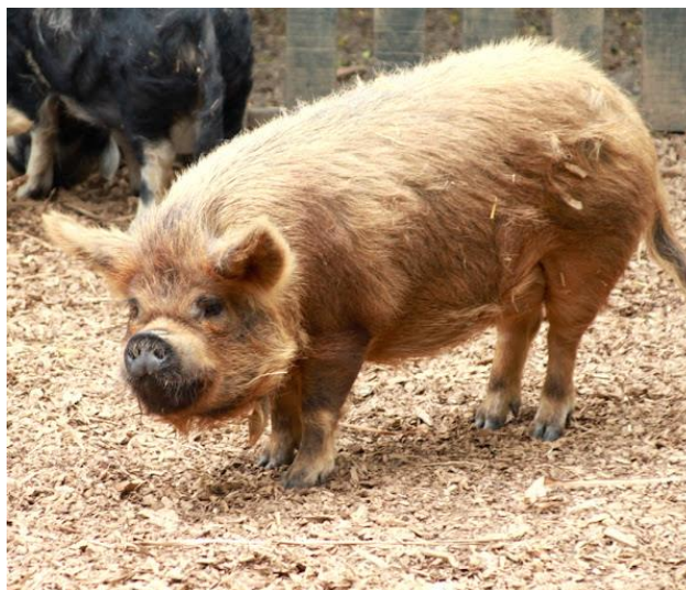
Slika 7: Smeđa KuneKune patuljasta svinja