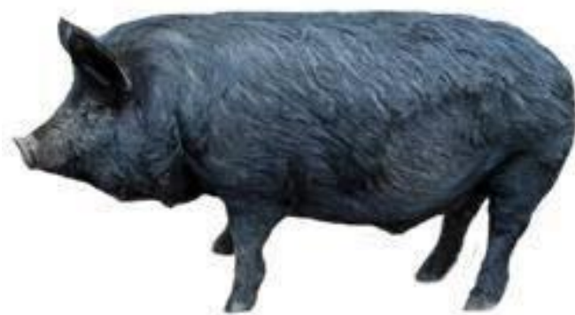
Slika 33: Gvinejska patuljasta svinja