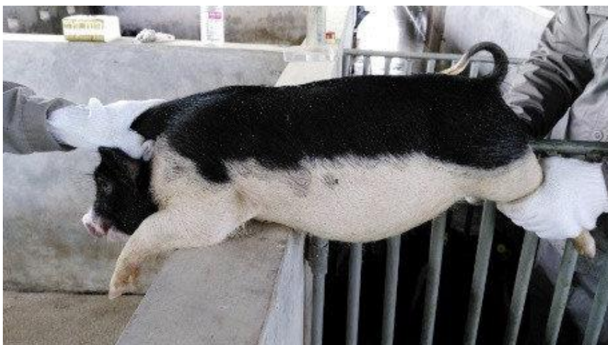
Slika 25: Specifična crno bijela boja pasmine

Više od desetak vodećih kineskih institucija, medicinskih škola i bolnica provodi istraživanja i pokuse na ovim svinjama. Kineska akademija za poljoprivredne znanosti objavila je 2015. godine sporazum o istraživačkim postignućima i o vlasništvu industrijalizacije Wuzhishan pasmine ( https://web.archive.org ).