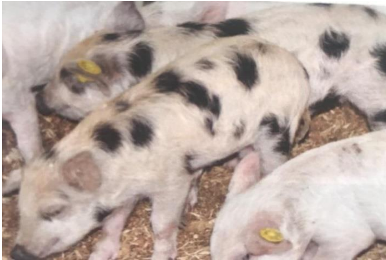
Slika 31: Westran patuljasti odojci

Svinje su crne boje ili bijele boje s crnim pjegama (slika 31). Težina odraslih mužjaka je do 80 kilograma, a ženki do 90 kilograma. Spolnu zrelost postižu sa 6 ili 7 mjeseci te imaju do 6 odojaka po leglu. Trenutno postoji samo jedna uzgojna linija u Sydneyu, u Australiji (McANULTY i sur., 2012.).