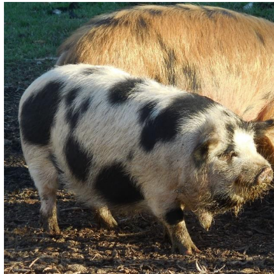
Slika 15: Bijela KuneKune svinja s crnim pjegama