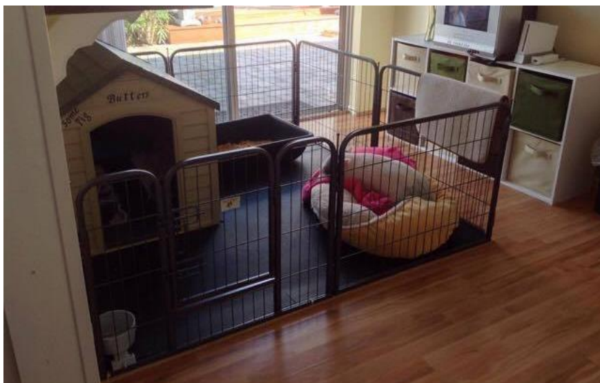
Slika 37: „Kućica“ za smještaj

Nuždu mogu obavljati u zasebnoj posudi, odnosno mjestu. Mogu se naučiti da to obave van kuće, tako da ih se od ranih dana svakih pola sata izvodi van i omogući da odaberu mjesto za to. Svim kućnim svinjama potrebno je omogućiti neko vrijeme na otvorenome. Zadovoljavajuća veličina prostora po svinji je 2,5 x 4,5 metara (slika 38). Za svinje koje su stalno smještene na otvorenom, stroge mjere biološke sigurnosti moraju se slijediti. Ograđivanje je obavezno kako bi se izbjegao izravan kontakt s divljim svinjama. Rubna ograda visoka 2,5 metra i 0,5 metara dubine spriječiti će svinje i druge životinje poput divlje mačke i divlje svinje od izlaska ili ulaska u prostor (JACKSON i COCKCROFT, 2007). Veći prostor potaknuti će više aktivnosti i vježbanja. Grube površine, poput betonske terase ili površine u prostoru za hranjenje ili na ulazu u sklonište, održavati će papke.