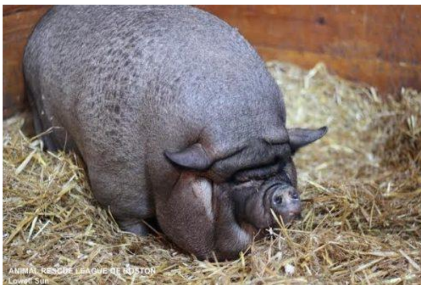
Slika 48: Pretila patuljasta svinja

Pretilost može biti povezana sa smanjenim unosom vode, što dovodi do stvaranja mokraćnih kamenaca i upale mokraćnog mjehura. Kontrolira se hranidbom manjim niskokaloričnim obrocima i poslasticama, tjelesnom aktivnosti i izbjegavanjem hranjenja ostacima hrane sa stola. Kako bi se prevenirala pretilost, važno je pratiti tjelesnu težinu i procijeniti kondiciju. Poželjno je osjetiti pojedinačno rebro prilikom palpacije prsnog koša. Neki vlasnici hrane svoje ljubimce niže od minimalne dnevne potrebe, kako bi ih održali malog rasta, što stvara stalni osjećaj gladi i zauzvrat dovodi do agresije.