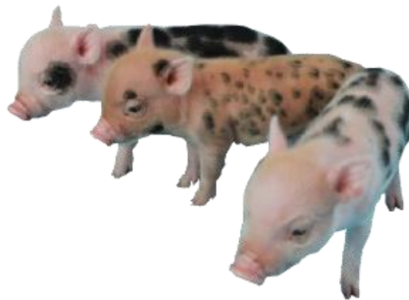
Slika 17: Julijana prašćići

Pjege su glavno obilježje pasmine (slika 17). Najčešće su crne boje no mogu biti bijele ili narančaste boje. Temeljna boja dlake može biti smeđa ili crna, no i srebrna, krem, bijela ili boja hrđe. Usporedno, kako životinja raste tako se smanjuju pjege na tijelu, ali nikada ne nestanu. Pjegavost može izbljediti ukoliko dlaka poraste, ali tijekom pranja ili brijanja pigmentacija treba biti postojana. Imaju grubu i gustu dlaku koja u zimskom razdoblju može biti duga ( https://americanminipigassociation.com ).