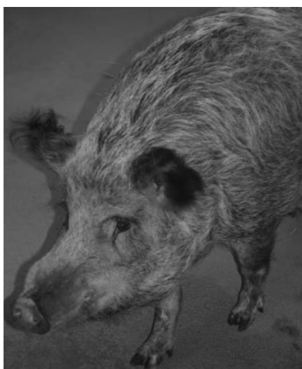
Slika 28: Munich patuljasta svinja (izvor: McANULTY i sur., 2012.)

Pasmina je nastala križanjem Hanford patuljaste svinje i kolumbijske minijaturne svinje, 1993. godine. Naziva se još Troll svinja. Uzgojena je prvenstveno za istraživanja o melanomu. Težina odrasle svinje je od 60 do 100 kilograma. Mogu biti bijele, narančaste, crne, tamnosmeđe boje i pjegave (slika 28). Spolnu zrelost dostižu s pet ili šest mjeseci starosti te po leglu mogu imati do osam odojaka. Poslušne su i aktivne. Malena populacija, ograničenog broja, nalazi se u Sveučilišnoj bolnici u Düsseldorfu, u Njemačkoj. Koriste se u istraživanjima kardiovaskularnog sustava, ortopediji i proučavanju implantata.