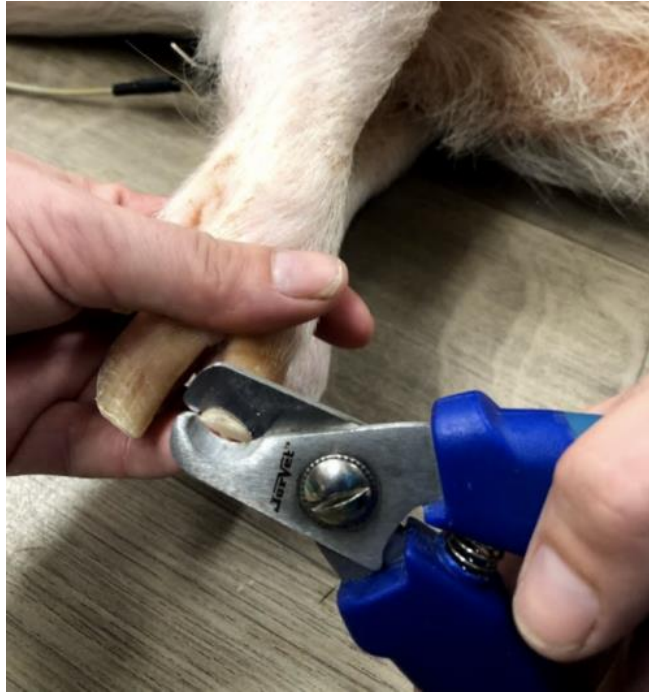
Slika 45: Podrezivanje papaka

Zubna njega iznimno je važna u patuljastih svinja. Novorođenim svinjama treba obrezati 8 sjekutića kako bi se spriječile ozljede u leglu i na dojkama krmače. U dobi od pet ili sedam mjeseci izbijaju stalni očnjaci tj. kljove. Kljove predstavljaju opasnost od ozljeda drugih kućnih ljubimaca, vlasnika i samoozljeđivanja. U mužjaka kljove rastu cijeli život, a kod ženki narastu do dvije godine starosti. Duge kljove se uvijaju natrag u lice što uzrokuje ozljede, infekcije i apscese (slika 46). Prvo ih se treba održati u dobi od jedne godine pa se podrezuju u starosti jedne do dvije godine u kastrata. Kod intaktnih mužjaka, podrezuju se svakih šest do dvanaest mjeseci. Zahvat kod većine zahtjeva primjenu opće anestezije ili sedacije te je popraćen cijepljenjem protiv tetanusa, uklanjanjem zubnog kamenca (slika 47) i drugih zubi u svrhu održavanja dobre zubne kvalitete (SWINDLE i HELKE, 2015.; https://www.merckvetmanual.com ).