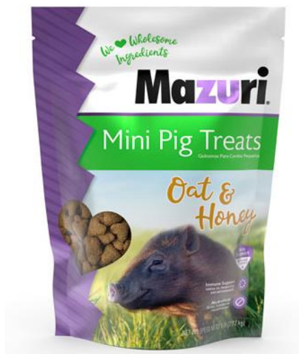
Slika 42: Poslastice proizvođača Mazuri