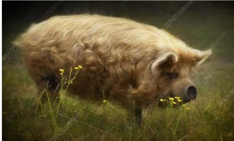
Slika 14: Zlatni tip 2 KuneKune patuljaste svinje