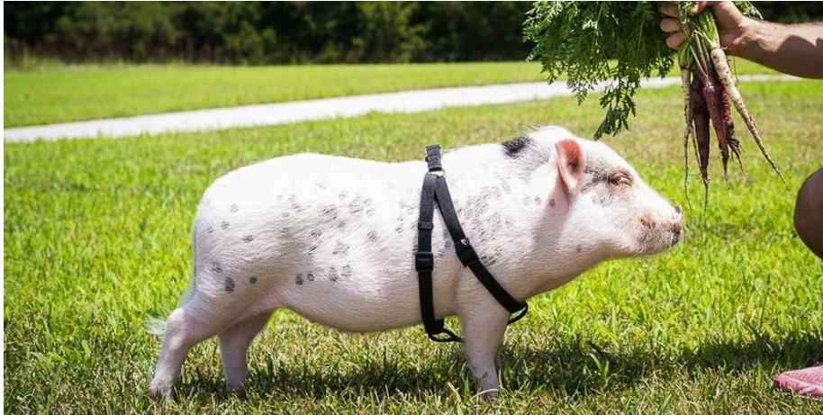
Slika 16: Julijana patuljasta svinja

koristile KuneKune svinje ( https://petpigworld.com ). Podsjeća na manju verziju divlje svinje ili velike domaće svinje. Atletske je građe i mršavijeg gojnog stanja, duže duljine nego visine tijela.