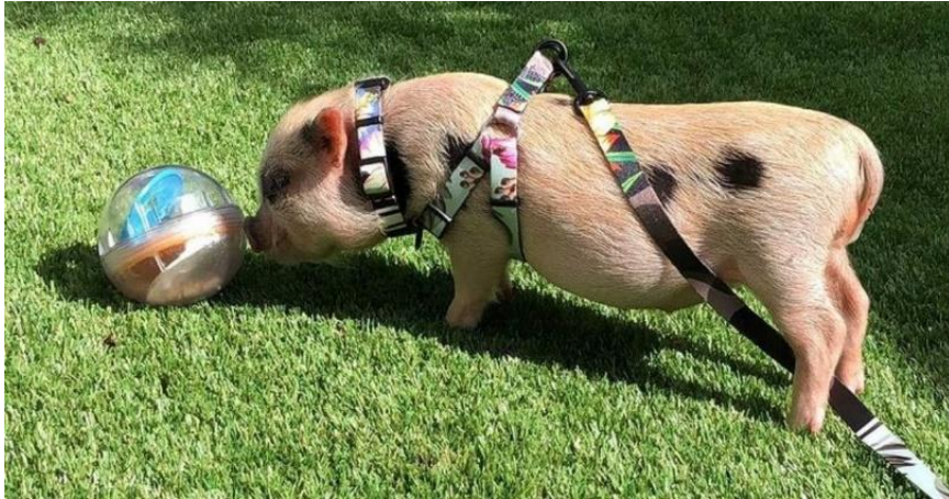
Slika 39: Svinja u igri loptom

Pješčanik je izvrsno mjesto gdje se svinja može zabaviti u mekanom pijesku, pogotovo ako se u njega skrivaju poslastice i igračke. Sijeno je odličan medij za hranjenje i rovanje, a kako je mekano, svinje uživaju u kovanju tražeći svoje grickalice. Mjesto za rovanje mogu biti veća drvena kutija ili plastični bazeni sa gumenom podlogom (slika 40) u koje se mogu staviti loptice za igru, veliko kamenje, plišane igračke, deke ili novine u koje se skrivaju poslastice.