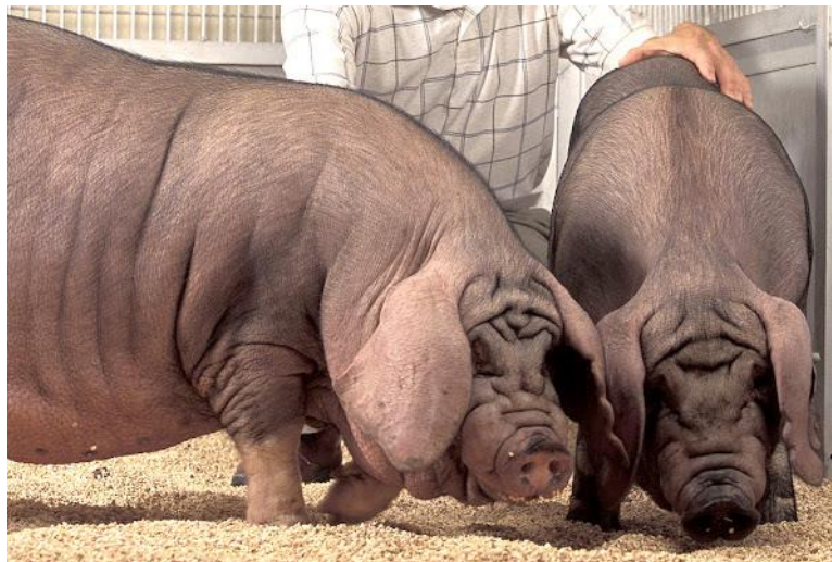
Slika 21: Meishan patuljaste svinje

Prosječna visina odrasle svinje doseže 57,8 centimetara, a težina 62 kilograma. Glava im je velika sa širokim čelom na kojem je naborana debela koža. Uške su im velike i spuštene te preklapaju kut usta. Podsjećaju na lepeze koje su imale gejšu. Rilo je kratko do srednje dužine, blago okrenuto prema gore i crne do ružičaste boje. Tijelo je opušteno i debelo s debelom i naboranom kožom. Koža je uglavnom crne boje (od svijetlo sive do tamno sive boje), prekrivena rijetkom dlakom, a u području velikog, bačvastog trbuha je ljubičasto crna. Imaju snažna leđa koja su blago ulegnuta. Rep je dug, ravan i srednje dlakav, obično crne boje, no može mjestimično biti i bijele boje. Noge su im snažne kako bi izdržale masivno tijelo. Mogu biti kratke ili duge, a u području papaka imaju bijele „čarape“. Ženke su uglavnom manje od mužjaka (slika 21) ( https://americanminipigassociation.com ; https://www.meishanbreeders.com ).