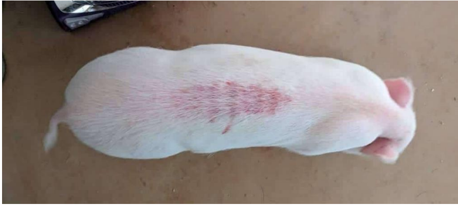
Slika 50: Serosanguinozne lezije na leđima svinje

Sindrom „ispuhane dlake“ stanje je kod trbušnih svinja, kod kojih se alopecija s potpunom ćelavosti primijeti za nekoliko tjedana. Uglavnom se javlja nakon gravidnosti ili bolesti (TYNES, 1999.).