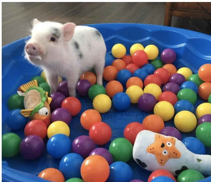
Slika 40: Mjesto za rovanje i igru

Pješčanik je izvrsno mjesto gdje se svinja može zabaviti u mekanom pijesku, pogotovo ako se u njega skrivaju poslastice i igračke. Sijeno je odličan medij za hranjenje i rovanje, a kako je mekano, svinje uživaju u kovanju tražeći svoje grickalice. Mjesto za rovanje mogu biti veća drvena kutija ili plastični bazeni sa gumenom podlogom (slika 40) u koje se mogu staviti loptice za igru, veliko kamenje, plišane igračke, deke ili novine u koje se skrivaju poslastice.