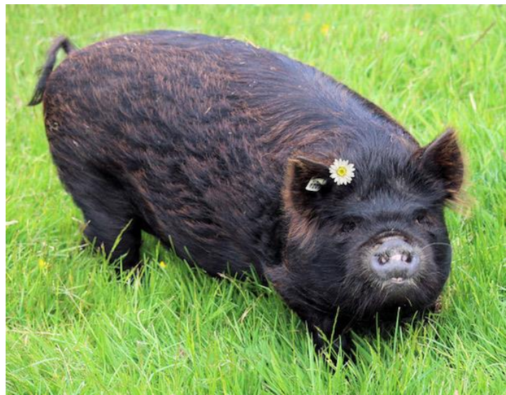
Slika 13: Zlatni tip 1 KuneKune pasmine