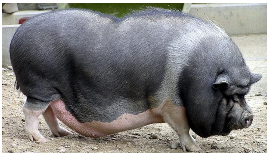
Slika 18: Vijetnamska trbušasta patuljasta svinja

Vijetnamska trbušasta ili kako je još nazivaju Pot - Bellied pig , Lon I te I svinja, danas je ugrožena pasmina patuljastih svinja. Poznata je po svom oblom trbuščiću po kojem je i dobila naziv (slika 18). Od davnina vijetnamske kulture simbolizira sreću, sigurnost i zdravlje te je dugo bila mnogobrojna domaća životinja. Nekada se brojnost izražavala u milijunima i uzgajala se za proizvodnju mesa. Unatoč sporom rastu, meso je opisivano kao vrlo ukusno. Populacija se počela umanjivati tijekom 1970-ih godina zbog njihova potiskivanja uslijed uvoza novih pasmina. Do 1991. godine njihov broj je bio oko 120 tisuća, a 2010. ih je bilo samo 120. Nacionalni institut za stočarstvo je status za ovu pasminu ocijenio kao „kritičan“, a FAO je pasminu postavio na listu ugroženih životinjskih vrsta. Nekolicina jedinki izvedena je u Švedsku i Kanadu 1960. godine, kako bi bile u zoološkim vrtovima. Kroz idućih deset godina pasmina se brzo proširila te ju se moglo naći i na manjim privatnim posjedima. U Sjedinjenim Američkim Državama pojavila se 1980. godine te je u kratkom roku postala popularan kućni ljubimac. No, ubrzo je zainteresiranost uzgajivača opala imajući u vidu da sve jedinice nisu bile čistokrvne te da je njihova odrasla veličina bila podosta veća od izvorne vijetnamske svinje.