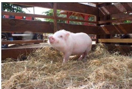
Slika 4: Odrasla patuljasta svinja