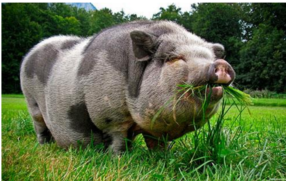
Slika 19: Vijetnamska trbušasta patuljasta svinja

Srednje je veličine, težine oko 50 kilograma, visine 38 centimetara u ramenima i dužine tijela oko 92 centimetra. Kao ljubimci mogu doživjeti do dvadeset godina, a u prirodi žive do petnaest godina. Neki podaci govore da mogu težiti i do 136 kilograma. Potpunu veličinu dostižu sa šest godina starosti, kada im srastu epifize kostiju nogu. Ima malenu glavu s malenim, ravnim ušima. Oči su joj malene, a njuška kratka i uspravna. Obrazi zajedno sa donjom čeljusti su debeli i opušteni. Tijelo je robusno i nabijeno. Leđa su uleknuta, a trbuh okrugao i bačvast te se u nekih može vući i po podu (slika 19). Zbog tog obilježja dobile su i ime „trbušasta“ svinja. Imaju kratke noge koje se oslanjaju na sva četiri prsta odnosno papka. Posjeduju karpalne žlijezde koje se nalaze na stražnjoj strani prednjih papaka kojima obilježavaju teritorij. Odrasloj svinji rep je ravan. Najčešće su jednoboje crne boje. Mogu biti i bijele boje te posjedovati pjege različitog oblika. Koža im je naborana i prekrivena rijetkom, srednje dugom dlakom.