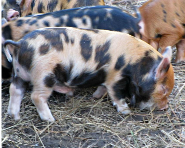
Slika 10: Trobojna KuneKune patuljasta svinja