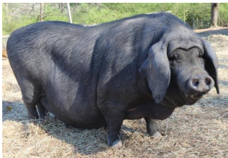
Slika 20: Meishan patuljasta svinja

Pojavljuje se u Sjedinjenim Američkim Državama 1989. godine, nakon što je određen broj jedinki prevezen iz Kine u USDA Centar za istraživanje mesa životinja i Odjel za animalne znanosti na Sveučilištu u Illinois-u. Istraživanja su okončana 2016. godine, a ova se pasmina proširila po cijelom sjevernoameričkom kontinentu ( https://www.meishanbreeders.com ). Važno je istaknuti da se tri uzgojna stada tokom istraživanja nisu međusobno križala. Tako je očuvana genetska osnova koja se promijenila tek kada su svinje puštene u slobodan uzgoj nakon 2016. godine ( https://livestockconservancy.org ).