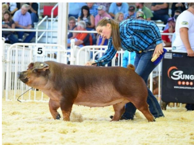
Slika 3: Odrasla svinja komercijalne mesne pasmine durok / Duroc