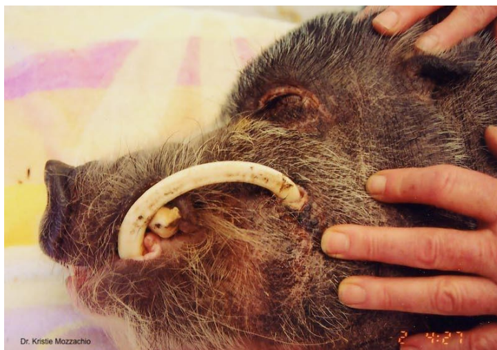
Slika 46: Duge kljove koje ozljeđuju obraz