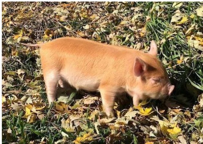
Slika 9: Boja "đumbira" kod KuneKune pasmine