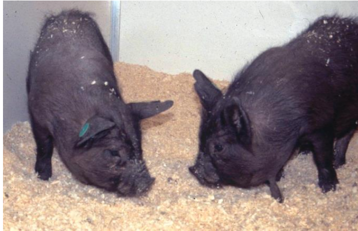
Slika 29: Panepinato patuljaste svinje

30 kilograma. Po leglu imaju do osam odojaka. Najčešće se koriste u istraživanjima dijabetesa te bolesti kardiovaskularnog sustava. U SAD-u postoji jedna uzgojna linija namijenjena isključivo za uzgoj u čistoj krvi.