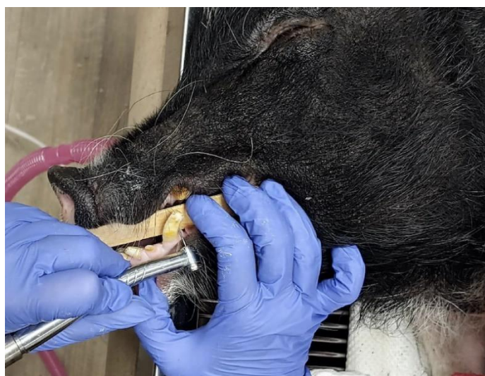
Slika 47: Uklanjanje zubnog kamenca

Većina svinja ima suhu i do nekog stupnja ljuskavu kožu. Diferencijalno dijagnostički mogu biti vanjske i/ili unutarnje parazitoze, suh zrak ili nutritivni deficiti. Koža se blago iščetka kako bi se odstranio površinski odumrli sloj odnosno ljuske. Potom se namaže kremom namijenjenu za suhu kožu. Slobodno se mogu koristiti one kojima se mažu psi ili ljudi. Nisu poželjna ulja ili uljne kreme zbog ljepljivosti i mogućnosti unosa nečistoća u organizam. Ukoliko se ne daju četkati, one svojim uobičajenim ponašanjem češanja o tvrde predmete, uklanjaju odumrle stanice kože (BRAUN i CASTEEL, 1993.).