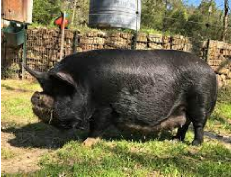
Slika 12: KuneKune svinja crne boje