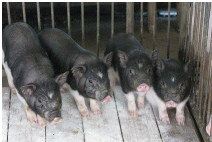
Slika 24: Wuzhisan prašičići

Wuzhisan je specifična kineska patuljasta svinja koja potječe iz tropskog područja Hainanu. Otkrivena je i uzgaja se od 1980. godine, te do sada broji oko 20 generacija čistokrvnih pripadnika. Imaju malu tjelesnu težinu, tanak oblik tijela i malu glavu s dugom njuškom. Stopalo ima četiri „papkasta“ prsta s dva veća središnja prsta koja nose najveći dio težine. Najčešće su crne ili smeđe boje s bijelim truhom i nogama i bijelim trokutom na čelu (slike 24 i 25). Vrlo su aktivne i nježnog temperamenta. Ženke narastu 50 do 70 centimetara duljine i 35 do 45 centimetara visine. Tjelesna težina im je do 25 kilograma. Spolnu zrelost postižu sa navršenih tri do četiri mjeseca, dok mužjaci postaju spolno aktivni otprilike s 1,5 mjeseci starosti ( https://www.thepigsite.com ).