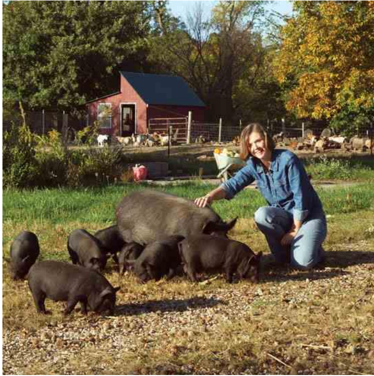
Slika 34: Gvinejske patuljaste svinje na gospodarstvu

Ova pasmina je odlična za obiteljska održiva gospodarstva (slika 34) jer je mirna i prijateljski raspoložena, a svinje se dobro slažu s djecom i drugim domaćim životinjama. Krmača ima dobre majčinske instinkte. Životni vijek im je do 15 godina.