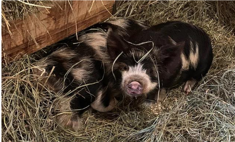
Slika 8: KuneKune patuljasta svinja crne boje s bijelim pjegama