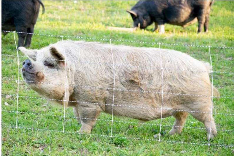
Slika 6: KuneKune patuljasta svinja boje "vrhnja"