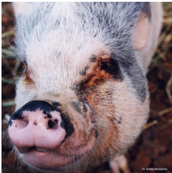
Slika 49: Crveno-smeđi očni iscjedak

Kod mnogih svinja pojavljuje se crveno-smeđi očni iscjedak (slika 49). Iako je to često normalan nalaz, treba se isključiti alergija, mehanička iritacija zbog entropije ili stranog materijala. Iscjedak se uklanja lagano toplom, vlažnom krpom ili vlažnom maramicom.