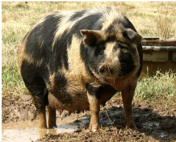
Slika 32: Ossabaw odrasla patuljasta svinja

Visina odrasle svinje je do 51 centimetar, a tjelesna težina do 90 kilograma. Odrasle svinje imaju gust dlačni prekrivač s debelim čekinjama na glavi, vratu i duž kralježnice. Čekinje su duge i „oštre“, što je karakteristika primitivnih pasmina. Rilo im je dugo, glava velika i teška kao i ramena, što ih čini nerazmjernima sa ostatkom tijela. Pojavljuju se u širokom rasponu boja, a najčešći su crni i pjegavi tipovi (slika 32). Mogu biti dobri kućni ljubimci jer imaju strpljivi i prijateljski temperament (EKARIUS, 2008.).