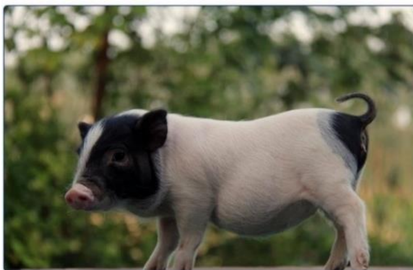
Slika 26: Bama patuljasti prašćić

Svinje su malene građe i imaju malenu glavu sa kratkim rilom te malene i kratke noge. Bijele su boje na većem dijelu tijela, pri čemu su prednji i stražnji kraj crni. Neke jedinke imaju blage crne mrlje na leđima i struku te bijele crte ili obrnute trokutaste bijele mrlje na čelu. Zbog specifično izgleda općenito su poznate kao „svinje s dva kraja crne boje“ (slika 26) ( http://pzdongfang.com ).