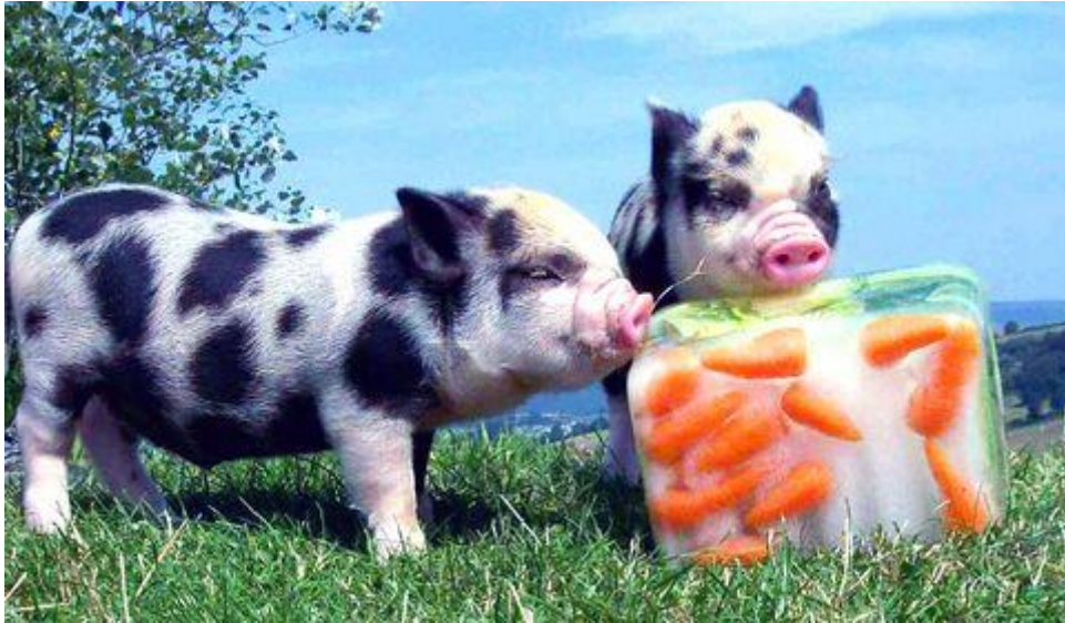
Slika 41: Blok leda s voćem i povrćem

poput lubenice ili bundeve. Voda se može pomiješati s voćem, povrćem ili sokom i smrznuti u blok (slika 41) koji će pružiti prijeko potrebno rashlađivanje i zanimaciju tijekom ljetnih mjeseci.