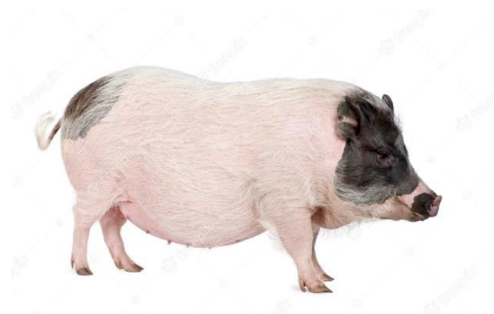
Slika 3: Göttingenska patuljasta svinja

Göttingenska patuljasta svinja, poznata još kao Gottinger ili Göttingenska mini svinja, prosječno teška 35 kilograma, smatra se među najmanjim ljubimcima pripadnika svoje vrste na svijetu (slika 3). Osim što su poznate kao najmanje, karakterizira ih iznimna poslušnost i opće dobro zdravstveno stanje. Uzgoj datira iz kasnih 1960-ih godina u Njemačkoj, na Institutu za Uzgoj i genetiku životinja Sveučilišta u Gottingenu, odakle i potječe sam naziv pasmine. Pasma je nastala križanjem Minnesota patuljaste svinje koja je uzgojena na Institutu Hormel u Sjedinjenim Američkim Državama, vijetnamske trbušaste svinje iz njemačkih zooloških vrtova i njemačkog landrasa. Ona je bila među prvim pasminama patuljastih svinja uzgajanih u Europi. Danas se u velikom broju uzgajaju na tri odvojena mjesta u svijetu: u Danskoj, iz koje se izvoze diljem zemlje i svijeta, u SAD-u, gdje bilježe njenu pojavu na početku 21. stoljeća tj. 2003. godine, zatim u Japanu od 2010. godine, kada su te svinje postale omiljene kao kućni ljubimci. Također, posljednja dva desetljeća povećan je njihov uzgoj kako bi se koristile u biomedicinskim istraživanjima.