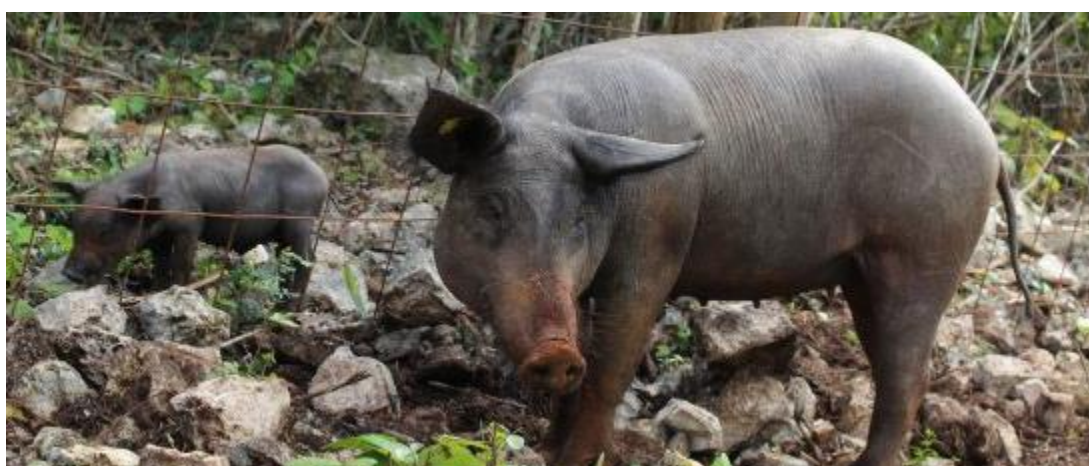
Slika 23: Yucatan patuljaste svinje

Odrasle ženke su visoke od 46 do 66 centimetara, dok su mužjaci obično viši, snažniji te imaju veću glavu sa izraženijom čeonom kosti. Teže do 95 kilograma, a ženke do 82 kilograma. Imaju velike, uspravne uši koje završavaju šiljasto. Glava im je duga i uska sa dugom i ravnom njuškom. Tijelo im je mršavije i mišićave građe. Leđa su ravna kao i trbuh. Noge su duge i snažne, a papci čvrsti. Životni vijek im je od 13 do 15 godina. Boja kože varira od svijetlo sive (boja kamena škrljevca) do crne boje.