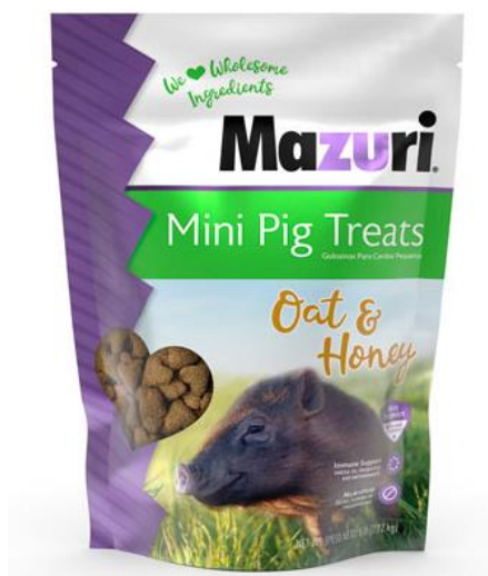
Slika 42: Poslastice proizvođača Mazuri