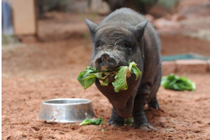
Slika 44: Patuljasta svinja jede zelje

mokraćnih kamenaca. Umjereno topla voda s dodatkom nekoliko žlica soka (brusnica, jabuka, naranča) potaknuti će svinju na napajanje.