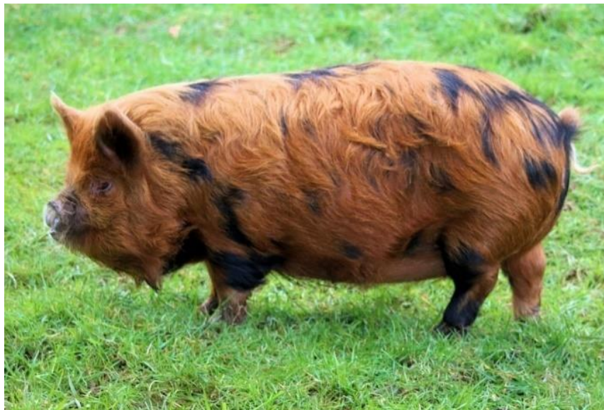
Slika 11: KuneKune patuljasta svinja "čumbir" crne boje