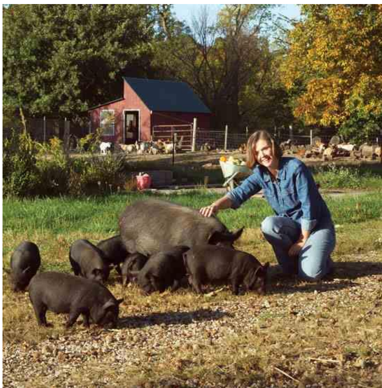
Slika 34: Gvinejske patuljaste svinje na gospodarstvu

Ova pasmina je odlična za obiteljska održiva gospodarstva (slika 34) jer je mirna i prijateljski raspoložena, a svinje se dobro slažu s djecom i drugim domaćim životinjama. Krmača ima dobre majčinske instinkte. Životni vijek im je do 15 godina.