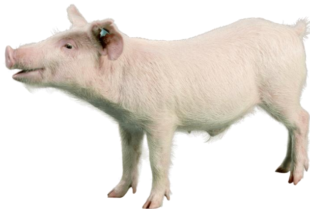
Slika 27: Hanford patuljasta svinja

Ova pasmina uzgojena je 1958. godine u Nacionalnom laboratoriju Hanford u saveznoj državi Washington. Nazimice Palouse pasmine su bile križane sa Pitman-Moore nerastima. Kasnije su njihovi potomci bili križani s divljim svinjama, a potom sa Yucatan patuljastom pasminom, kako bi im reducirali veličinu. Obilježja ovih svinja su bijela boja kože, bogat dlačni pokrivač, smanjen udio potkožnog masnog tkiva i dobra prilagodljivost laboratorijskim istraživanjima (slika 27). One su plahe životinje, bez agresivnih osobina i jako društvene. Težina odrasle jedinke je od 80 do 95 kilograma. Postižu spolnu zrelost sa 6 mjeseci i po leglu mogu imati do sedam prašića. Trenutno u svijetu postoji samo jedna populacija u Sinclair Bio-istraživačkom centru u Auxvasse-u, Missouri. Mogu se prodati uz uvjet da se ne smiju uzgajati. Preteča su drugih pasmina kao što su Munich patuljasta svinja i Hanford-Hormel patuljasta svinja.