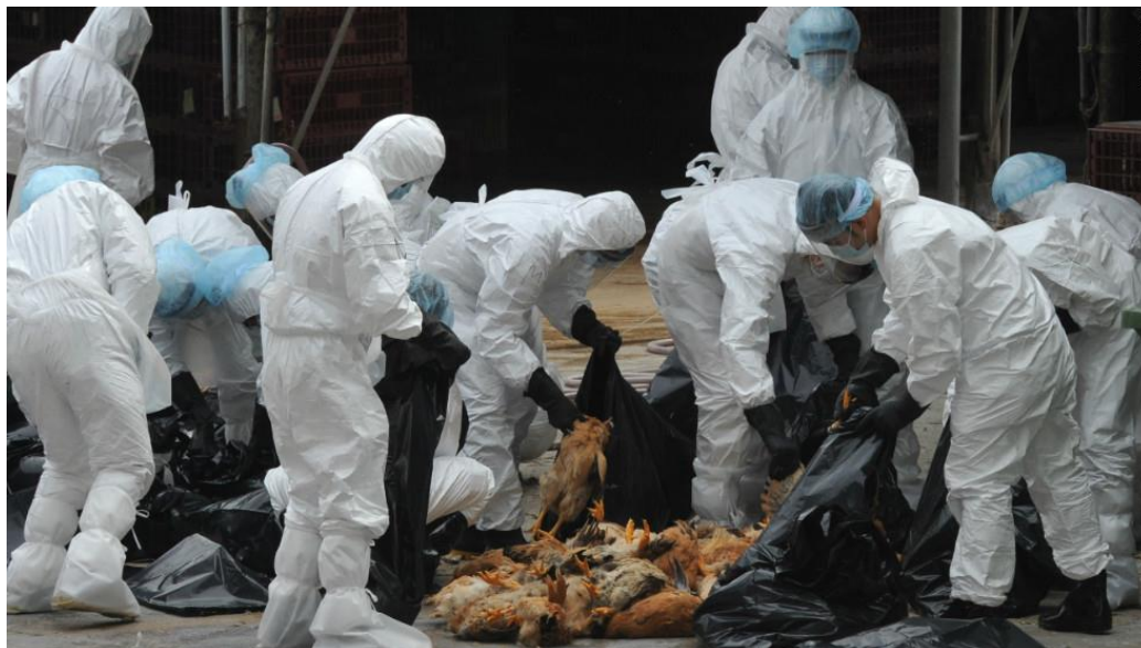
Slika 7. Uklanjanje lešina preventivno zaklane peradi.

provodi zakapanjem ili odvozom u kafilerije (slika 7). U područjima gdje se zakapanje smatra prigodnim, iskopana rupa mora biti barem 2 metra duboka i široka što omogućuje zakapanje cca. 300 jedinki s prosječnom težinom od 1,8 kg. Lešine se potom prekriva slojem kalcijevog hidroksida i slojem zemlje od minimalno 40 cm debljine. Pri prijevozu u kafileriju, vozilo mora osigurati nemogućnost istjecanja sadržaja u okoliš (IZSVe, s.a.).