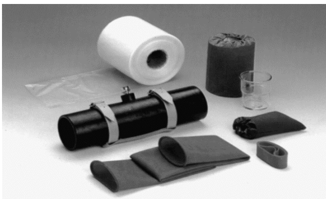
Slika 2. Umjetna vagina, model Hanover (HURTGEN, 2009.).