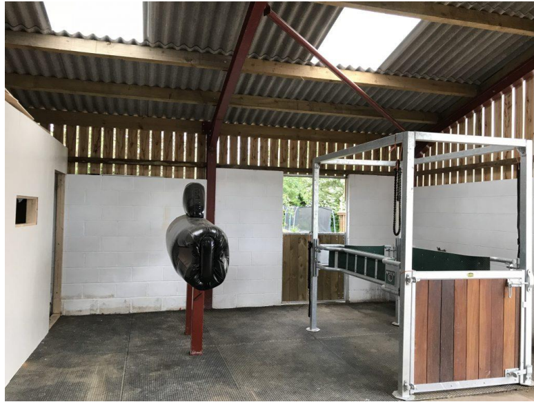
Slika 4. Prikaz fantoma i stojnice za kobilu (IZVOR:

http://www.redheartappaloosas.co.uk/artificial-insemination-semen-collection-redheart-appaloosa-stud/ ).